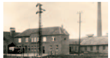
Die Grafschafter Krautfabrik um 1920