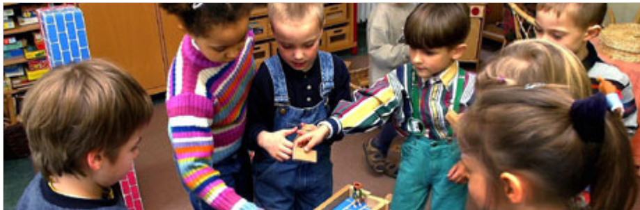
Erwachsene Kinder sollten nicht so viel Geld verdienen - sonst streicht der Staat das Kindergeld. Bei diesen Knirpsen dürfte diese Gefahr jedoch nicht bestehen.

920 Euro erkennt das Finanzamt von sich aus generell bei jedem Arbeitnehmer als Werbungskosten an, die ihm durch seinen Beruf entstehen. Wer über diesem Pauschbetrag liegt - und das kann vor allem dann sein, wenn man einen etwas weiteren Anfahrtsweg zur Arbeit hat - sollte weitere Ausgaben geltend machen. Kursgebühren für eine Fortbildung, Bewerbungskosten, Ausgaben für Fachbücher und -zeitschriften, Büromaterial - all das drückt die Steuerlast. Auch die Anschaffung eines PCs oder eines Schreibtischs kann sich lohnen. Kostet das einzelne Teil mit Umsatzsteuer nicht mehr als 487,90 Euro, so schlägt der Preis 2009 voll zu Buche. "Es muss dann nicht über mehrere Jahre abgeschrieben werden", sagt Siemers.